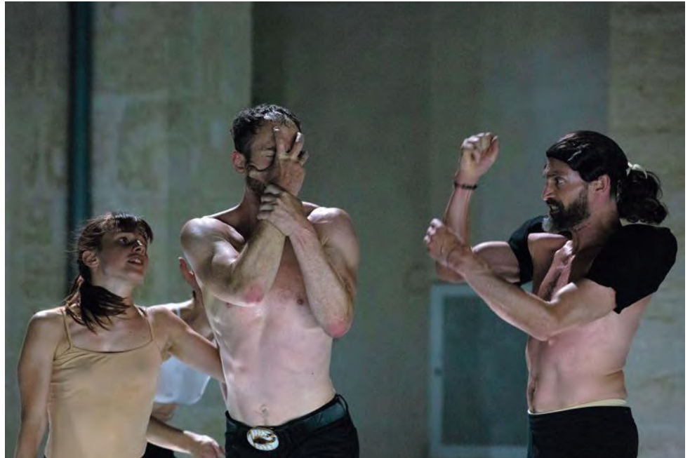
Boris Charmatz. « infini ». 2019.

Boris Charmatz est né en/was born in 1973. Il vit à Bruxelles/He lives in Brussels.